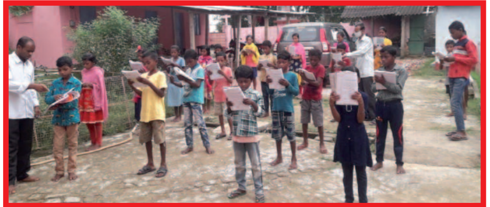
Samen zingen in de buitenlucht

Gelukkig zijn er de dorpsschooltjes! Dit zijn 'schooltjes' onder een boom of in een klein gebouwtje, georganiseerd vanuit het particulier initiatief. Deelname is gratis. Hier gaan doorgaans de basisscholieren uit het dorp die op een overheidsschool zitten naar toe om - vóór en ná school - de officiële taal van de deelstaat te leren. Het onderwijs op de overheidsscholen wordt namelijk in die officiële taal gegeven en de dorpskinderen spreken die taal niet. De kinderen krijgen er ook bijles in de schoolvakken. De eerste drie maanden na de lockdown waren ook deze dorpsschooltjes gesloten. Maar daarna slaagde men erin om - met in achtneming van de COVID-protocollen - deze schooltjes tot op de dag van vandaag veilig open te houden.