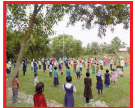
Viering van Onafhankelijkheidsdag

Omdat door de lockdown veel mensen hun werk en daarmee hun inkomen kwijtraakten, zorgde de leiding van de dorpsschooltjes voor voedselpakketten met rijst, linzen, olie, specerijen en zeep. Dit lukte zelfs ook toen tijdens de ergste periode van de pandemie de dorpsschooltjes nog gesloten waren.