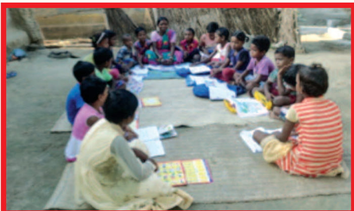
De dorpsschooltjes waren open

De hostels hebben een deel van de sponsorinkomsten besteed aan mobieltjes voor afstandsonderwijs, mondkapjes, medicijnen en voedsel om zo de kinderen en gezinnen door de pandemie heen te helpen. Ook is geprobeerd om de lonen van het personeel zo lang mogelijk door te betalen. Duidelijk is dat alle activiteiten gericht waren op het in stand houden van de bestaande organisaties, hostels en dorpsschooltjes. SAC ondersteunt deze visie van harte. Onze partners daar zijn SAC dankbaar voor de financiële steun die hen in staat stelde om te doen wat het beste was voor de kinderen. Ze hebben de structuren zoveel mogelijk overeind gehouden zodat de kinderen - wanneer ze weer terug mogen komen - organisaties aantreffen die klaar staan om hen te ontvangen. Onze partners in India schrijven verder dat de kinderen ondanks de vele beperkingen ook goede dingen hebben meegemaakt. Het is fijn om bij je ouders te zijn, het afstandsonderwijs was een leuke ervaring, de hygiënische COVID-maatregelen zijn een goede leerschool. En we lezen dat de kinderen ook weer graag naar school willen! SAC bedankt alle geweldige sponsors, die ervoor gezorgd hebben dat ondanks de pandemie de deur voor de kansarme kinderen open bleef!